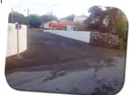
Impasse de la Grange après

Le montant global de l'opération se chiffre à 35000 € TTC.