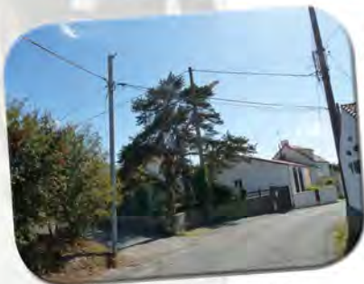
Impasse de la Grange avant

L'impasse de la Grange a été élargie en fin d'année 2014, sa chaussée a été restructurée. L'aménagement a été réalisé par la société Bréhard. L'ouvrage (350 m 2 de voirie) permettra d'y sécuriser la circulation. Le réseau de captage des eaux pluviales a également été rénové, un appui France Télécom a été supprimé.