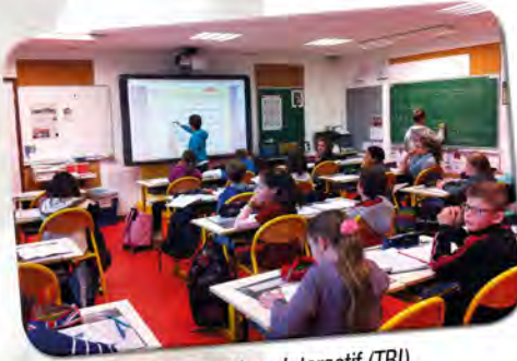
Tableau Blanc Interactif (TBI)

Le groupe scolaire René Guy CADOU vient d'être doté d'un 7 e tableau blanc interactif (TBI) . Grâce à cet équipement, il est possible d'afficher un texte ou un dessin à partir d'un ordinateur et d'annoter ce document numérique directement sur l'écran sans passer par le clavier de l'ordinateur.