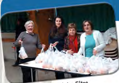
Comité des Fêtes

Comme chaque année, la mairie a organisé le lundi 15 décembre un spectacle de Noël pour les enfants des écoles.