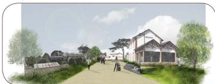
Esquisse du projet (Parvis côté sud)

Le coût du chantier est de 382 636.53 € HT. La commune reçoit les subventions du Conseil Régional à hauteur de 113 383 €, du Conseil Général pour 76 527.31 €, de la Réserve parlementaire pour 20 000 € et une subvention libératoire RFF pour 96 198.92 €. Reste à charge pour la commune 76 527.31 €.