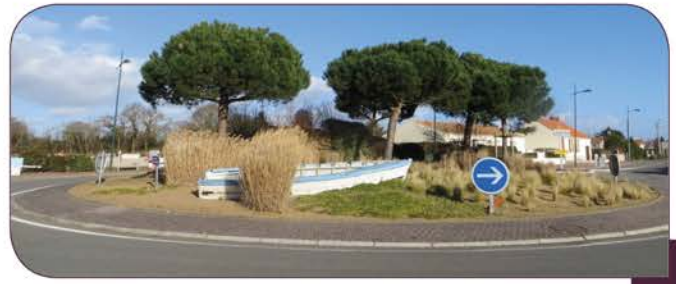
Rond point de la Rogère

L'aménagement du rond-point est en cours de renouvellement. L'ensemble de la végétation, les enrochements ainsi que la barque sont retirés du site, seuls sont conservés les cinq pins déjà en place. Un engazonnement est prévu ainsi que la plantation de plantes vivaces et d'arbustes rampants. Ces plantations seront finalisées à l'automne.