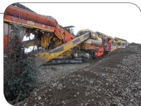
Dégarnisseuse qui soulève la voie, enlève le ballast, le tamise et le mélange avec du nouveau ballast pour ensuite reposer la voie

Toutes ces phases requièrent de nombreux passages sur l'itinéraire et, malgré une programmation revue quotidiennement, les aléas et la progression du chantier ont provoqué des fermetures de PN supplémentaires. Cette modernisation a permis de remettre à neuf nos cinq