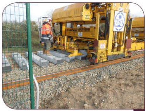
Pose des nouvelles traverses en béton