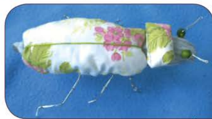
Créations avec du tissu

Soyez inventif comme vous savez le faire à chaque concours !