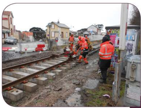
Boulonnage des voies sur les traverses