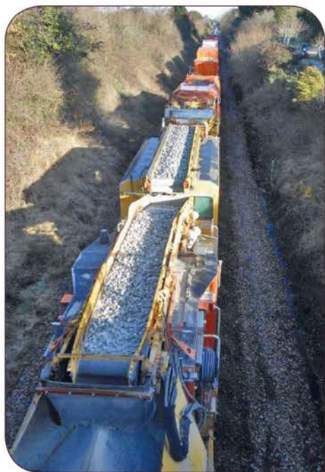
Dégarnisseuse passant sous le pont au Petit Bois Moisan

passages à niveau dont un fut élargi et le carrefour attendant réaménagé (Rue de la Villardièrre / Rue Gilbert Burlot). Fermé en début de chantier, le passage à niveau de la Thébauderie a quant à lui été supprimé de façon définitive.