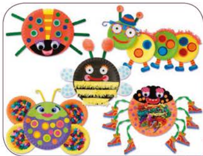
Créations avec des assiettes en carton

Le printemps est enfin parmi nous. La nature revit, les oiseaux chantent, la végétation retrouve des couleurs et les petites bêtes sortent de leur hibernation.