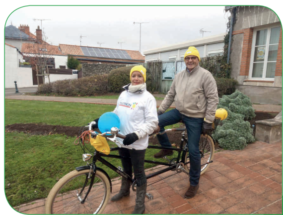
Fil rouge de l'édition 2016

Grâce à tous, L'AFM-Téléthon peut poursuivre ses missions de toujours AIDER ainsi que GUÉRIR et construire un tremplin pour relever les défis de demain : mettre des médicaments à disposition des malades.