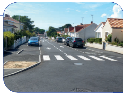
Rue du capitaine Debouté

Les travaux de voirie terminés, nos services techniques finalisent l'aménagement des espaces verts aux emplacements préalablement réservés.