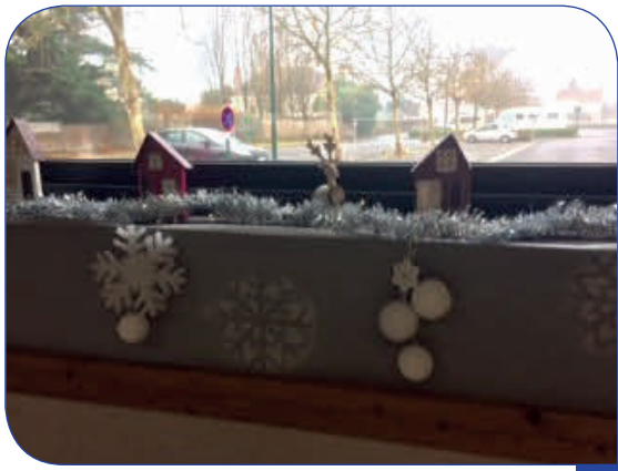
Décoration confectionnée par les enfants de Roule Ta Bille