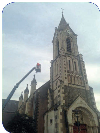
La pose de témoins sur le clocher