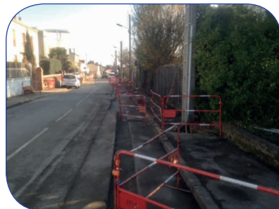
Effacement de réseaux rue de Pornic