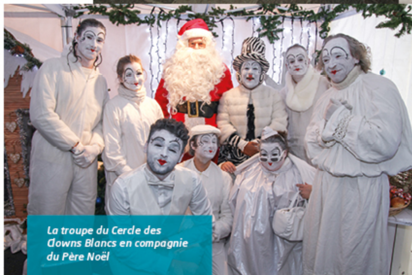
La troupe du Cercle des Clowns Blancs en compagnie du Père Noël