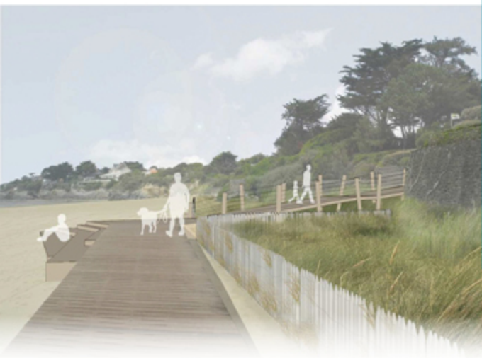
La prolongation du platelage en haut de la Grande Plage

« Les cinq premiers projets débiteront tous en 2018. Les aménagements de l'avenue Gilbert Burlot seront quant à eux programmés ultérieurement. »