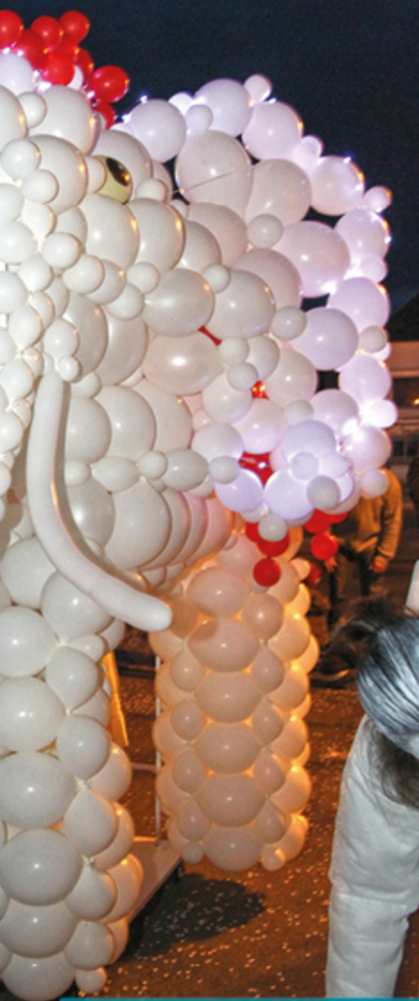
«La Parade Wonderland»