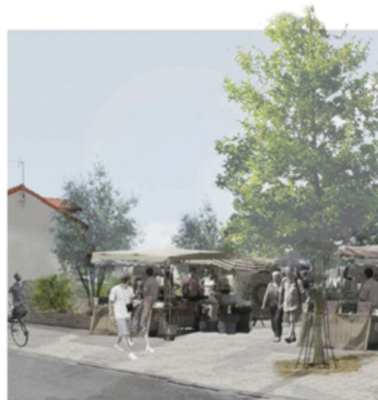
L'aménagement et l'extension de la place Laurent Chiffolleau