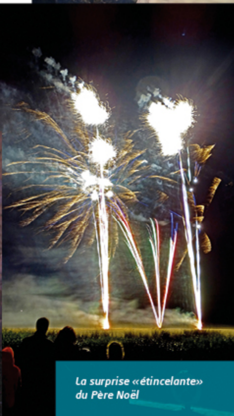
La surprise «étincelante» du Père Noël