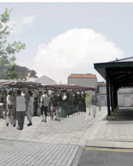
L'aménagement et l'extension de la place Laurent Chiffolleau