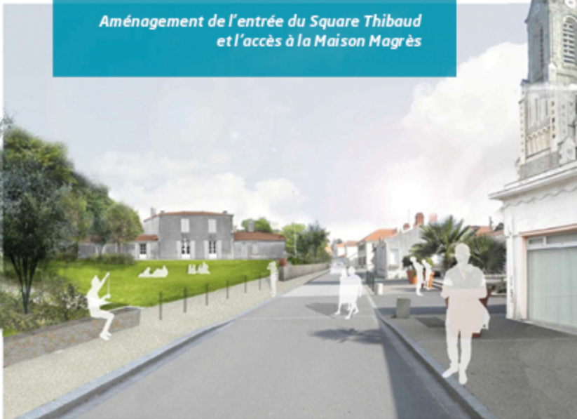
Aménagement de l'entrée du Square Thibaud et l'accès à la Maison Magrès