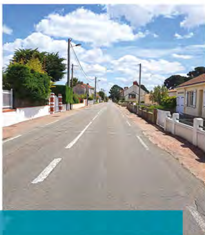
Rue des Moutiers