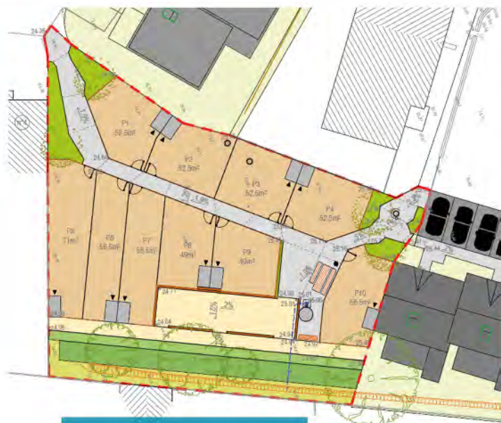
Plan des jardins

La revalorisation du quartier Henri Barau va se poursuivre avec la rénovation complète des logements anciens du parc social d'Espace Domicile, comprenant notamment le remplacement de l'ensemble des menuiseries, l'isolation par l'extérieur et le ravalement des logements.