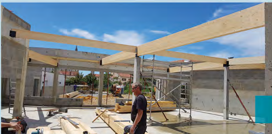
Intérieur de l'ALSH