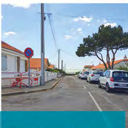
Avenue Edgar Maxence