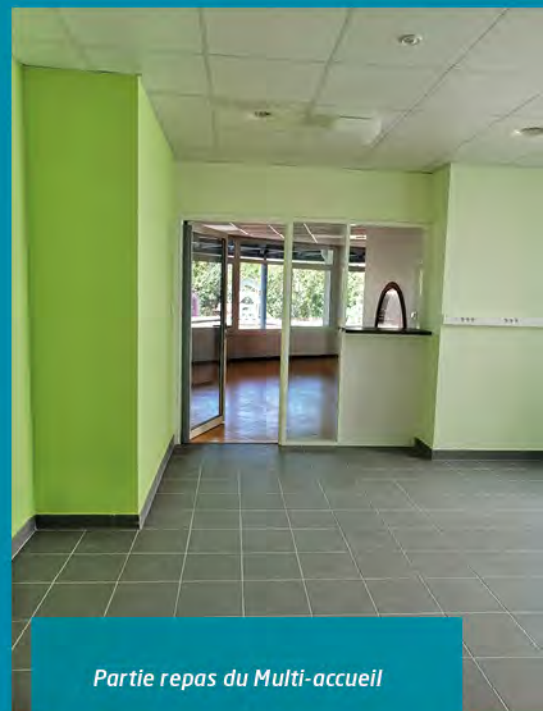
Partie repas du Multi-accueil

Aujourd'hui achevé, il sera mis en service en même temps que le bâtiment ALSH.