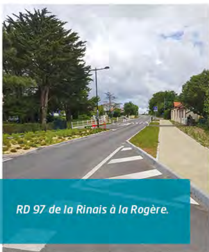
RD 97 de la Rinais à la Rogère.