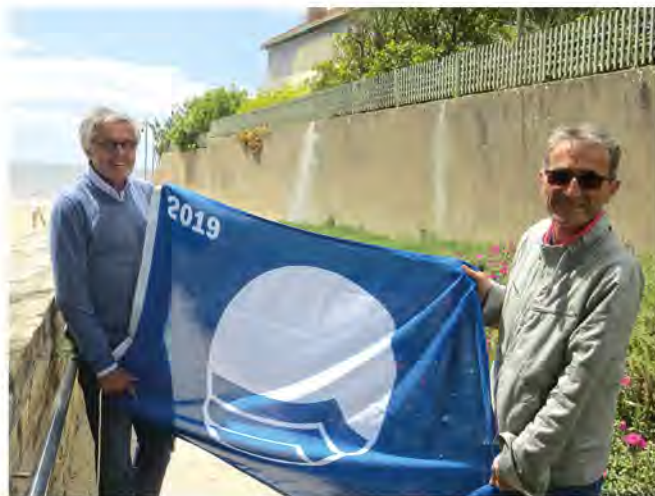
La cérémonie de remise des labels Pavillon Bleu a eu lieu le 22 mai à Plouhinec (Morbihan)