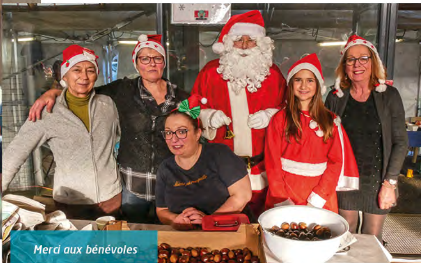
Merci aux bénévoles