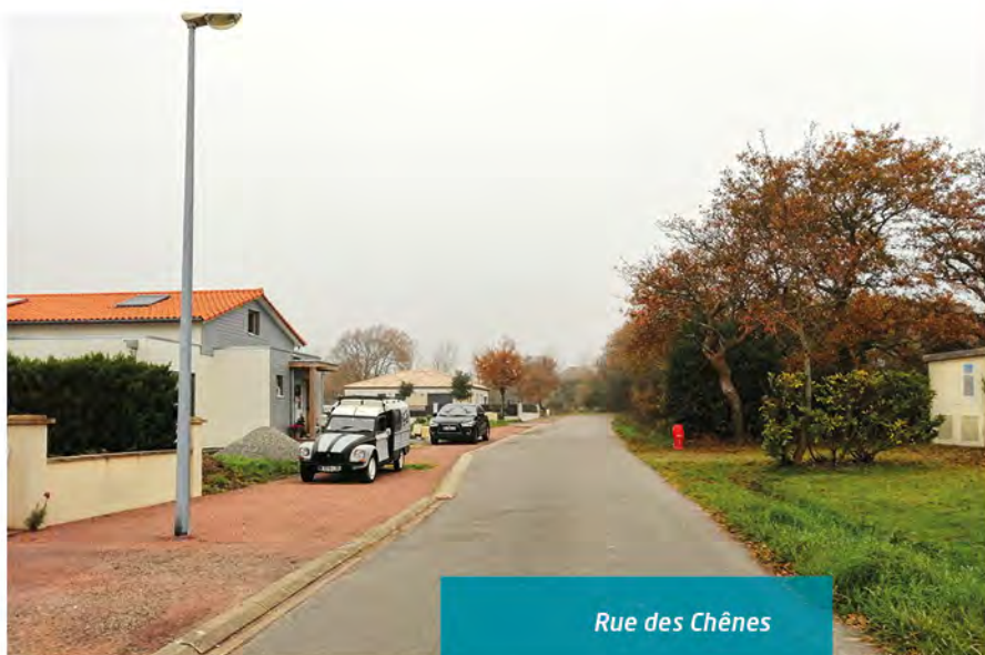
Rue des Chênes