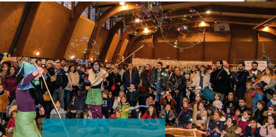
Feu non bulle

Un grand merci à tous les bénévoles pour leur participation lors de ce week-end conviviale et festif et merci à nos partenaires : le Super U d'Arthon-en-Retz et l'Océanic.