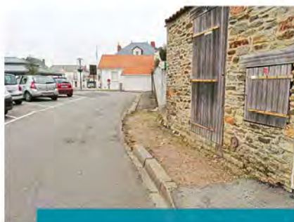
Edicule rue Chaussée du Pays de Retz

Ces travaux ont été attribués à l'entreprise BREHARD TP pour 119 349,55 € TTC