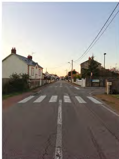
Impasse des Nourettes

En complément deux extensions seront réalisées rue des Chênes avec remplacement des luminaires dans la rue des Erables et l'impasse des Nourettes.