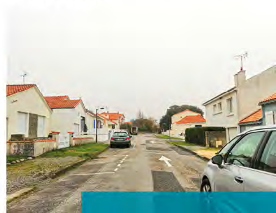
Rue Armor Lucas

L'aménagement des rues Lucas, d'Armor et de Loisirs est en cours de consultation des entreprises et débutera au premier trimestre 2020.