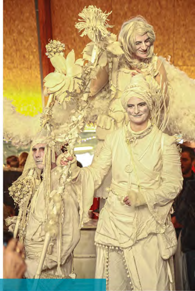
Les Marcheurs de Rêves