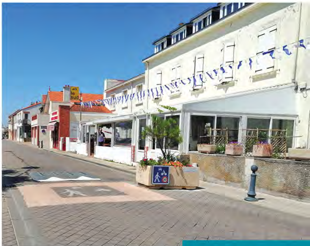
Zone de rencontre

Plusieurs projets sont en cours de réflexion, comme l'installation d'un parking déporté pour réduire la circulation dans le centre l'été ou le passage sur la commune de la navette estivale venant de Pornic. Les résultats de l'enquête réalisée