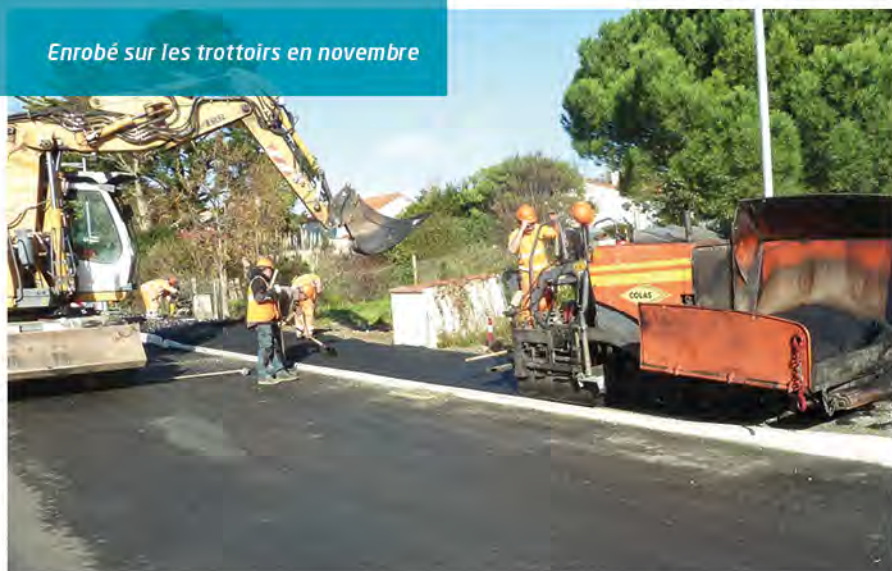
Enrobé sur les trottoirs en novembre

L'aménagement paysager va pouvoir commencer, pour une fin des travaux prévue en février 2021.