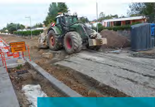
Retraitement des matériaux en octobre

Les travaux d'infrastructure de la rue Burlot sont en voie d'achèvement : la chaussée a été restructurée au mois d'octobre par un retraitement des matériaux en place, solution plus rapide, plus performante et moins chère.