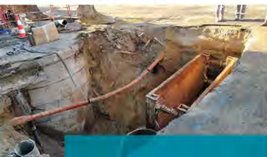
Intervention au carrefour rues des Carrées - Tamaris

Pour le secteur de la rue des Carrés, les travaux ont débuté le 14 février pour s'achever également mi-juin. Ils sont décomposés en 4 phases. Le coût de l'opération est de 961 000 € TTC.