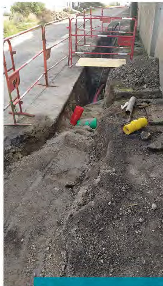
Travaux d'enfouissement rue Sourdille

Le renouvellement de la couche de roulement de la rue des Moutiers est également envisagé, mais des interventions à entreprendre sur les réseaux d'eaux usées ont été détectées par les services de Pornic Agglo Pays de Retz. Bien entendu, ces travaux devront être réalisés avant toute intervention sur la chaussée.