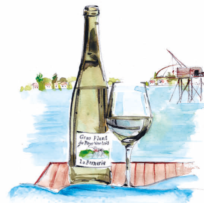
Vin produit à La Bernerie-en-Retz