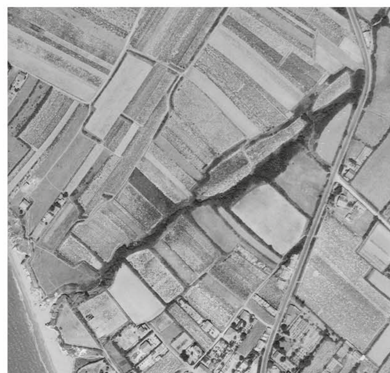
Le vallon de Versannes couvert de vignes en 1949

Difficile d'imaginer que ce vallon était il y a encore quelques décennies quasiment couvert de vignes. Pour beaucoup de communes du Pays de Retz, la culture de la vigne est ancienne, il en est fait mention dans les archives de l'abbaye de Buzay (Rouans) au milieu du 13 e siècle. Sur la Bernerie-en-Retz, les vignes sont partout, quelle qu'en soit l'exposition et la pente. Le vin récolté, notamment le Gros-Plant, parfois qualifié de « rustique », était destiné essentiellement à la consommation courante des habitants.