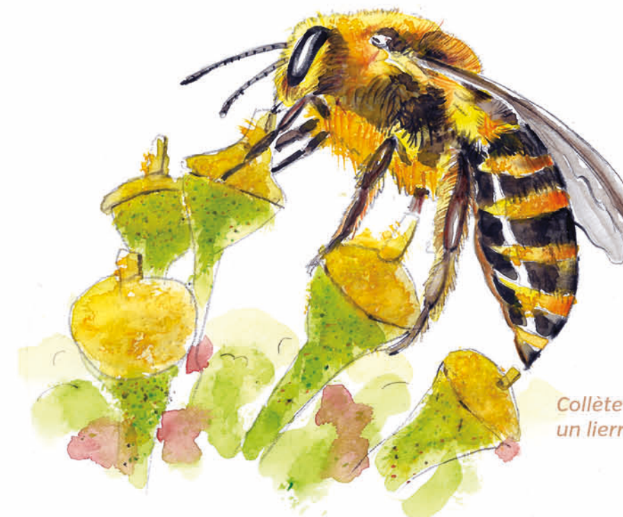
Collète du lierre qui pollinise un lierre grimpant

La gestion différenciée permet de proposer une ressource alimentaire pour les insectes pendant une bonne partie de l'année. La Collète du lierre, une abeille sauvage présente aux Roches Dorées, pollinise essentiellement le lierre grimpant, qui est en fleur à l'automne. On dit qu'elle est monolectique, car elle ne pollinise qu'une seule plante. Laisser le lierre pousser dans ces prairies permet à de nombreux insectes de se nourrir à une période où les ressources florales se font rares.