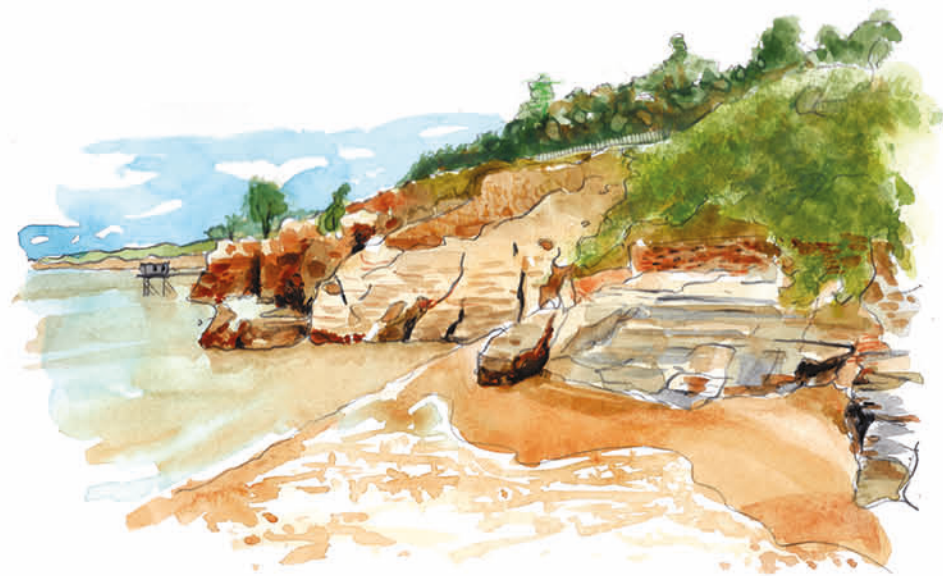
Plage des Roches Dorées

Ce site naturel protégé s'étend sur 2 ha. Il est composé d'une prairie en partie arborée, séparée en son milieu par le ruisseau de la Villardière, dont les eaux se jettent dans l'océan au niveau de la plage des Roches Dorées.