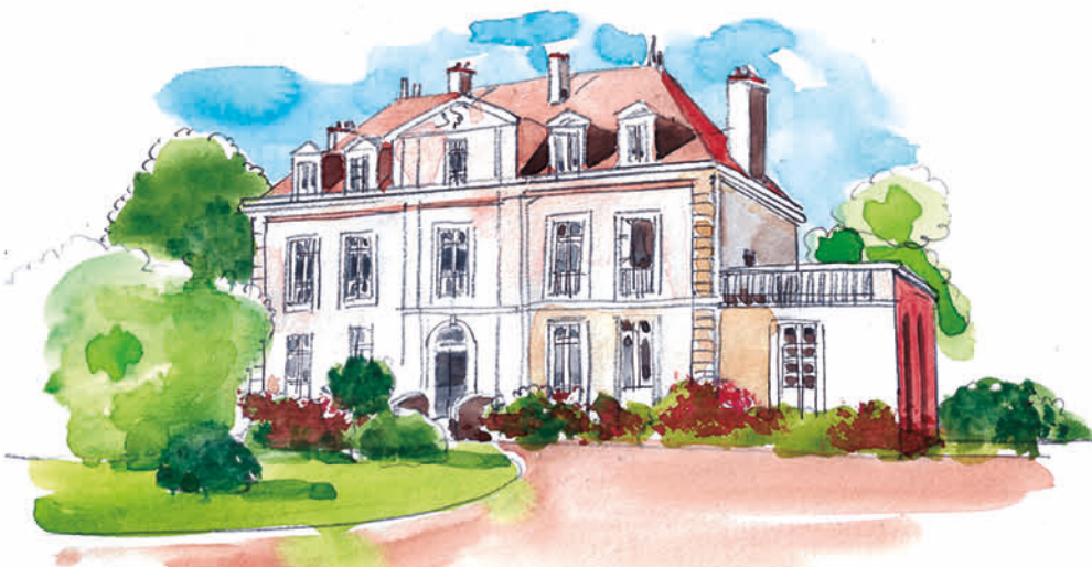
Château de la Gressière

Outre sa belle bâtisse de la fin du 19 e siècle, le domaine de la Gressière possède un bois abritant principalement des chênes et quelques ormes. C'est un lieu de promenade prisé des bernériens et bernériennes notamment pour son côté ombragé.