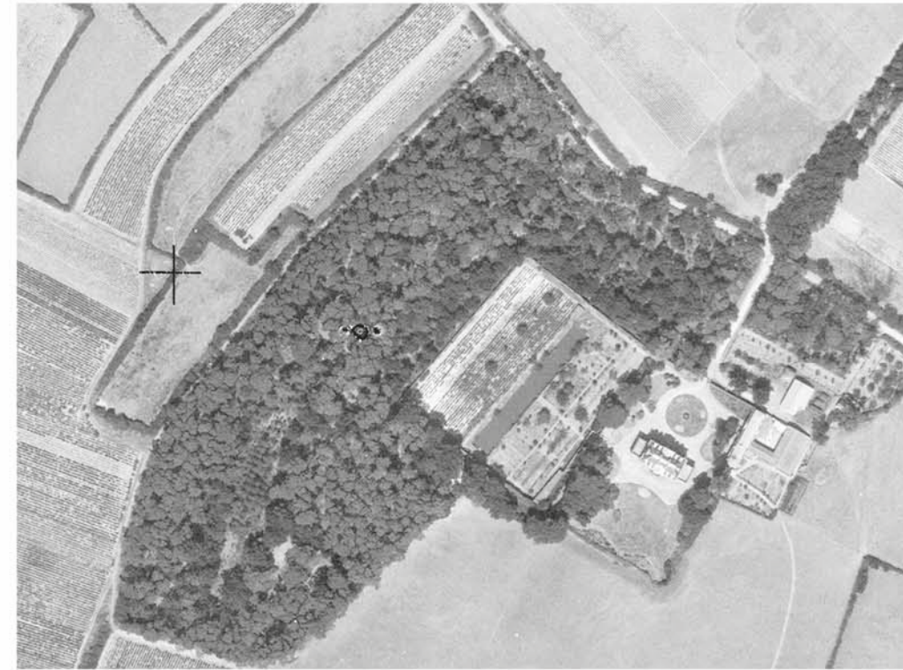
Le château et le bois de La Gressière en 1949 et en 2025