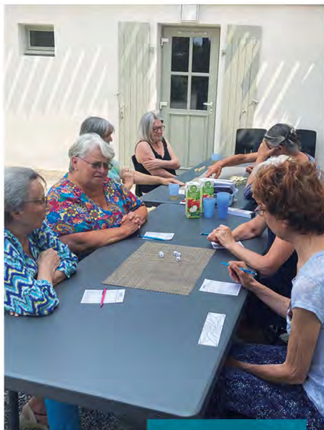
Parties de Yam's