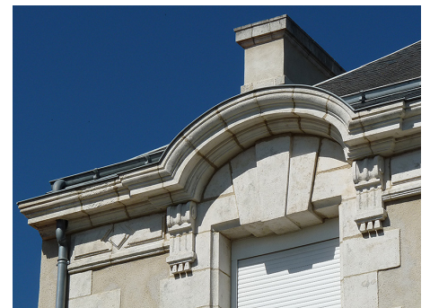
Corniche, encadrements et décors sculptés en calcaire pour une villégiature bourgeoise de la fin du XIX e siècle.