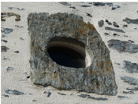
Rare encadrement monolithe en schiste d'une très ancienne maison rurale de La Bernerie.

Au cours des siècles, les formes des linteaux, le dessin des moulurations des corniches et des appuis, la qualité de taille des pierres, ont connu des évolutions techniques et stylistiques, et ces éléments sont devenus des modes d'embellissement et de distinction des façades. Pour les architectures les plus simples, ce sont souvent les seuls éléments qui permettent de dater une construction, de lui donner son caractère.