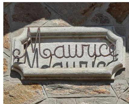
Pierre à bandeau mouluré formant cartouche pour mettre en valeur le nom de la maison.

On ne recouvrera jamais une corniche par un enduit ou une peinture étanche.