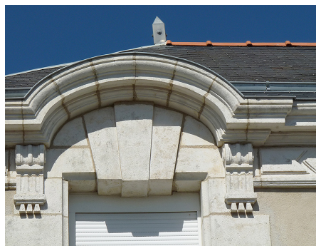
Corniche moulurée formant une fausse lucarne au-dessus de la fenêtre de l'étage. Villégiature bourgeoise de la fin du XIX e siècle.

Si des pierres sont défectueuses, on les remplacera à l'identique de matériau et de forme, en respectant le dessin de la mouluration