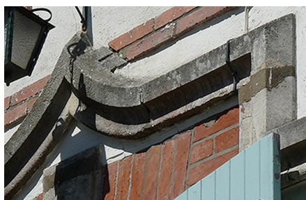
Moulure décorative en pierre de style néo-gothique, en mélange avec une modénature en brique.