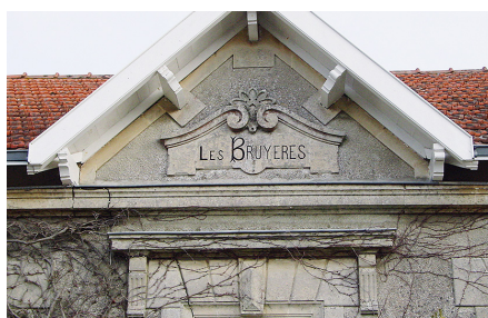
Corniche, encadrements et cartouche sculpté en calcaire pour une villégiature de la fin du XIX e siècle.