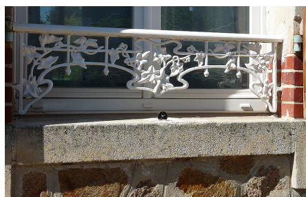
Appui de fenêtre en pierre dure, en simple débord par rapport au mur. D'autres sont moulurés comme une corniche.