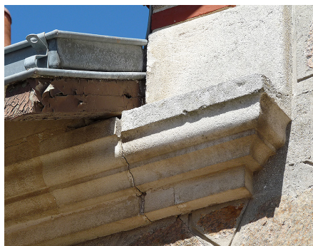
Corniche moulurée soutenant les coyaux de charpente. Le joint entre les pierres se dégrade à cause d'un défaut d'étanchéité au-dessus de la corniche.

Les joints entre les pierres seront exclusivement réalisés avec un mortier de chaux et de sable, dans une teinte proche de celle de la pierre.