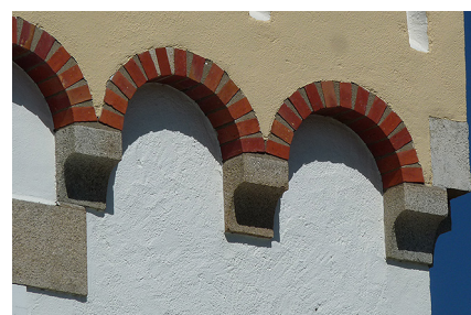
Le granite apparaît parfois à La Bernerie, comme ici en mélange avec la brique sur une villa « mauresque ».